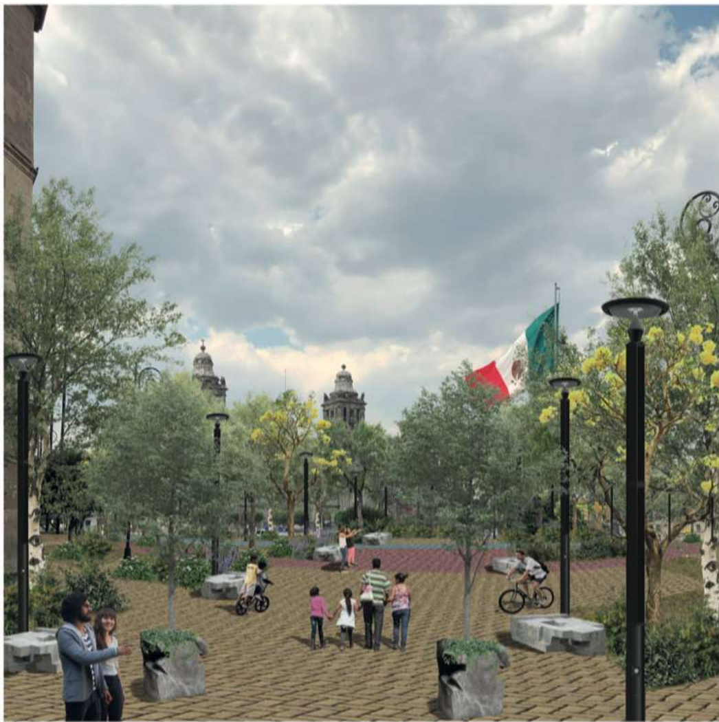
1. Acceso 16 de septiembre y 5 de febrero