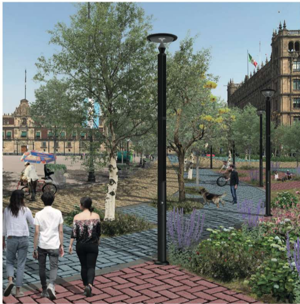
2. Sendero de corredor vegetado