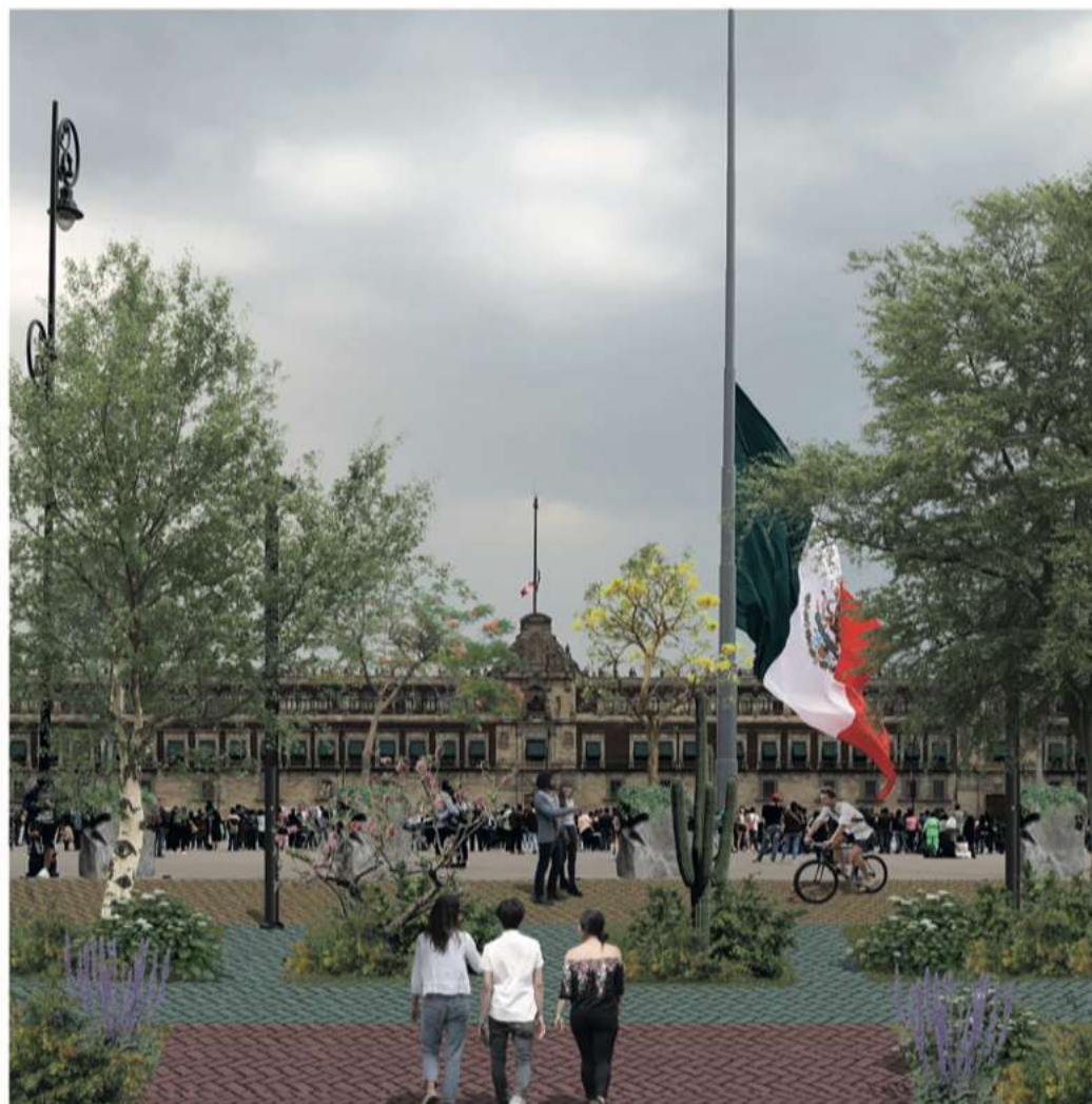
4. Corredor vegetado y asta bandera