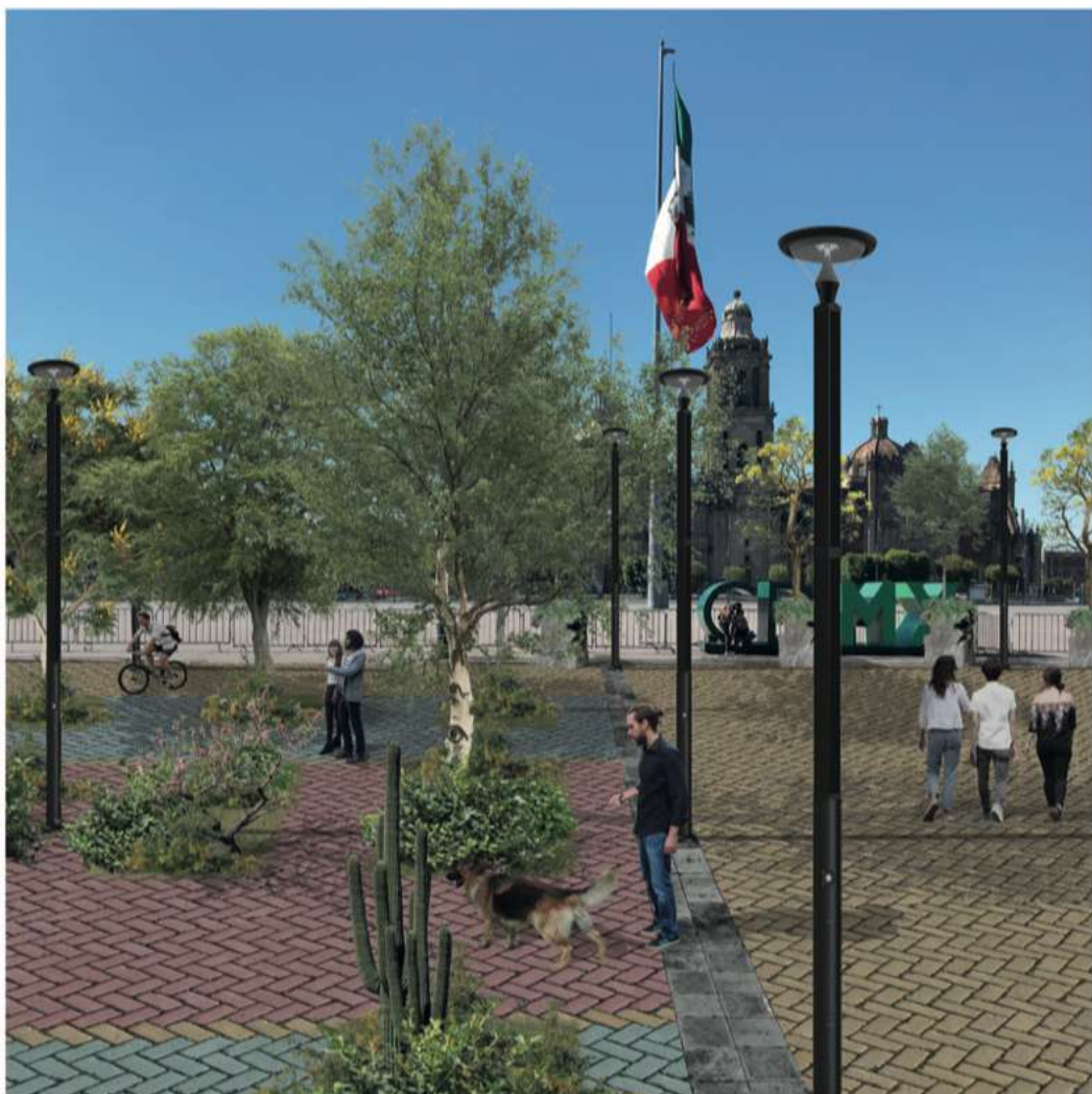
3. Cruce 20 de noviembre y corredor vegetado